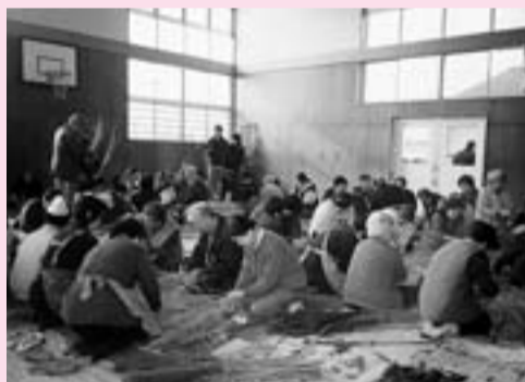
「しめ縄づくり」はお年寄りたちが活躍