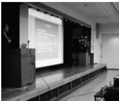
毎日新聞・野沢社会福祉部副部長の講演

11月26日(土)・27日(日)盛岡市総合福祉センターで「イーハトーブからの発信! どうなる障がい者福祉」と題したフォーラムが開催されました。26日(土)は、障害者自立支援法について厚生労働省・藤木課長の講演に引き続き、「障がい者福祉と介護