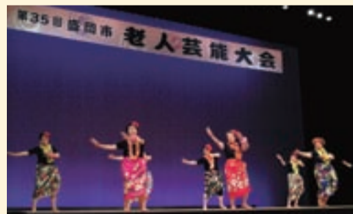
昨年の芸能大会のようす

市内の60歳以上の方々による芸能等の趣味活動を広く発表する機会をもうけることにより、生きがいを高めることを目的に、第36回盛岡市老人芸能大会が開催されます。主催は盛岡市・盛岡市老人クラブ連合会・盛岡市社会福祉協議会です。