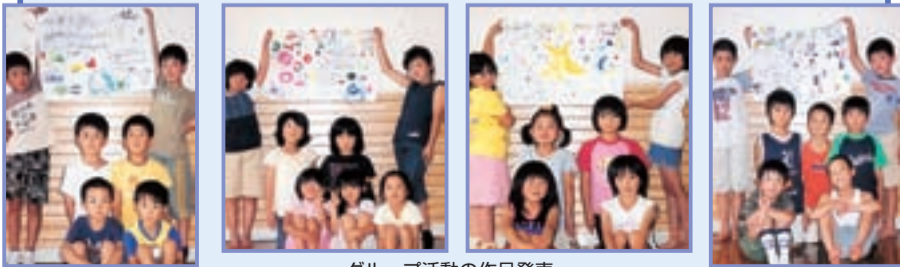
グループ活動の作品発表