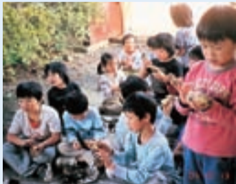
大好評のヤキイモ会。みんな目が真剣！