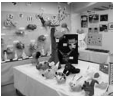
夢の観察園・キラキラズム水族館

市内の養護学校や特殊学級などの児童による合同作品展が11月10日(木)～15日(火)の6日間、盛岡市総合福祉センターで開催されました。展示会場にはカラフルで個性的な作品が数多く展示されました。主催は、盛岡市