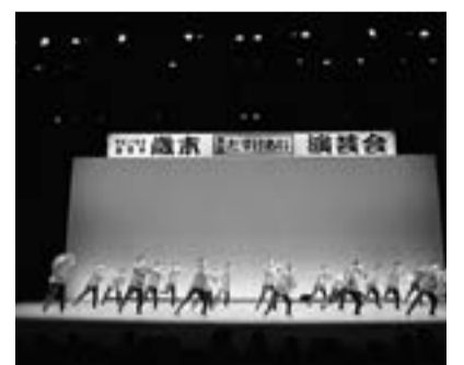
太田健康体操ひまわり会の健康体操

12月13日(火) 岩手県民会館大ホールで盛岡市歳末たすけあい演芸会が開催されました。町内会の婦人部など38団体が踊りや合唱、フォークダンスなどを披露しました。主催は、盛岡市退職女性教職員の会・盛岡市地域女性団体協議会・岩手県母子寡