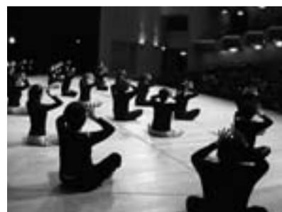
みんなで楽しむヨーガ

なお、この演芸会で皆さまから寄せられた募金は、盛岡市歳末たすけあい運動に寄付されました。