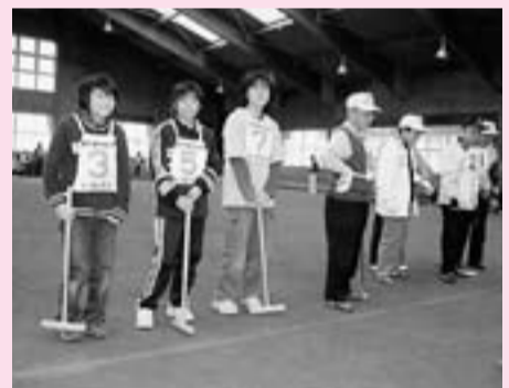
お年寄り子どもたちが一緒になって世代交流ゲートボール大会