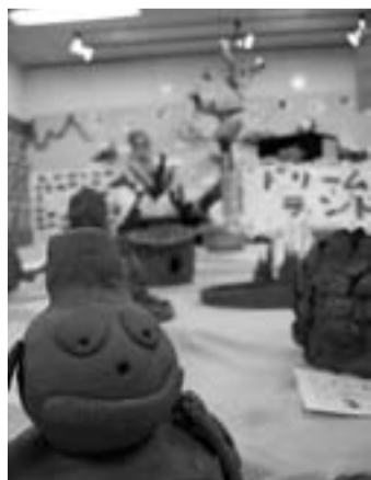
ねんど細工のドリームランド

教育委員会・盛岡市特別支援教育研究会。共催は、盛岡市手をつなぐ育成会・盛岡市社会福祉協議会・盛岡市障害児教育推進協議会。