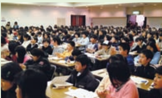
他の子ども会活動を興味深く聴く参加者

連絡先 盛岡市社会福祉協議会内 盛岡市子ども会育成会連絡協議会 TEL(651)1000 FAX(622)4999