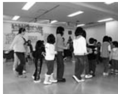
みんなで輪になってゲームの始まり!

12月18日(日)盛岡市総合福祉センターで母子家庭・父子家庭の親子が参加したクリスマス会