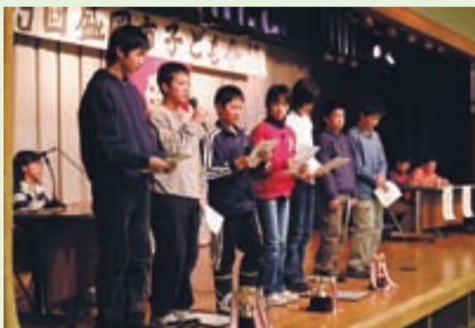
昨年の活動事例発表のようす

第50回 盛岡市子ども会議は、地域で活動する子ども会リーダーが一堂に集い、それぞれの活動を発表しあい、情報交換を行う場として開催されます。