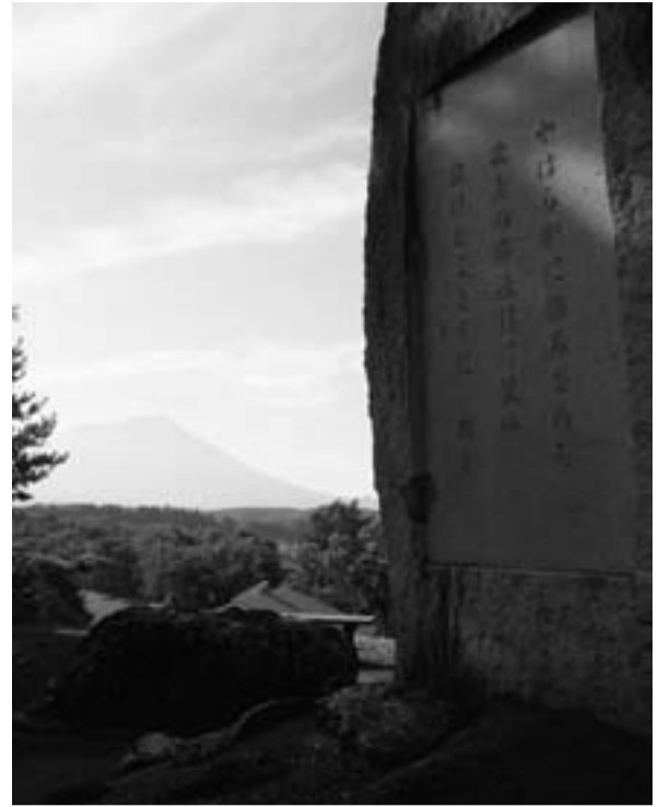
渋民公園から望む岩手山