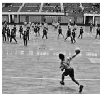
熱を帯びる決勝戦

8月12日(日)、第36回盛岡市子ども会スポーツ大会(主催:盛岡市子ども会育成会連絡協議会・盛岡市社会福祉協議会)が盛岡市アイスアリーナ(本宮字松幅100-1)を会場に開催されました。