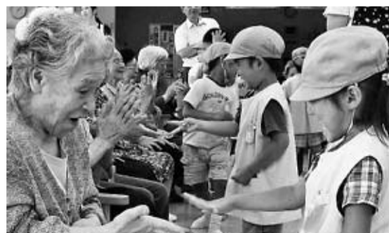
じゃんけんぽん、あいこでしょ

8月2日(火)と3日(金)、月が丘デイサービスセンター利用者と岩手県立こまくさ幼稚園(月が丘1丁目23-1)の園児との交流会が開催されました。園児たちによる歌を聴いたり、一緒に手遊びをしたりと、とても楽しい時間を過ごしました。