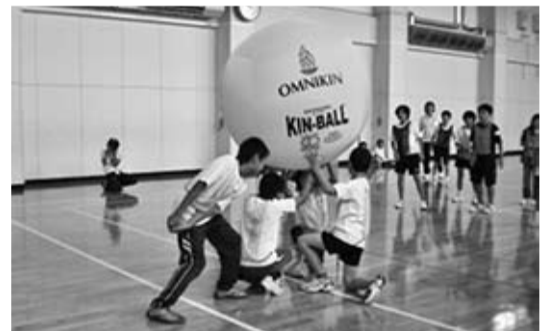
「オムニキン…ブラック」

7月3日(火)、浜民運動公園総合体育館で玉山区内7つの児童館、学童クラブに通う243人の児童が集まって玉山区児童館祭りが開催されました。ドッジボールやキンボール、ユニカールなどの競技を通じて、他の児童館の子どもたちとの交流を図りました。