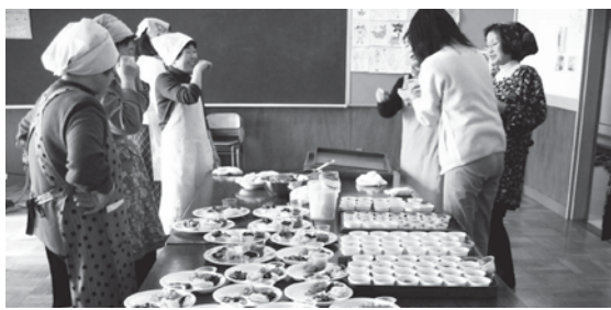
味見しながら会話がはずむ