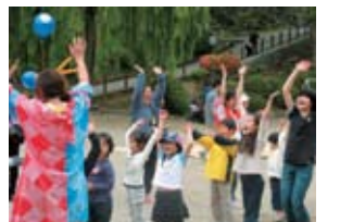
綱引きに勝ち、歓声を上げる子どもたち