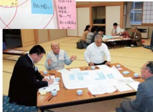
自分たちの住む地域の理想の姿について話しあうワークショップ参加者たち

ワークショップでは、参加者たちが思い描く地域の姿や、実現に向けての取り組み方法などが模造紙に貼り付けられました