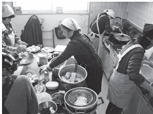
小さな台所を巧みに使いこなして

2月のある日、西見前の世代交流センターの台所は朝から慌ただしかった。毎月恒例の見前地区福祉推進会のふれあいの会に提供する昼ご飯の準備が始まるのだ。