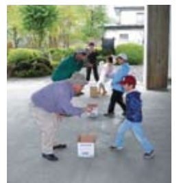
雨天のため、ゲーム大会となった去年の様子

※雨天時は、市立図書館駐車場でゲーム等を行います。 主催 盛岡市子ども会育成会連絡協議会、盛岡市社会福祉協議会