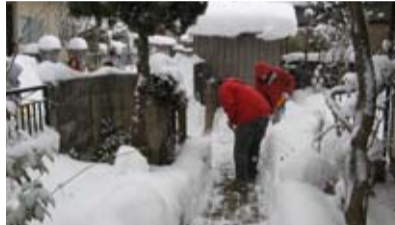
写真は昨年の活動の様子

盛岡市社会福祉協議会では、除雪に困っている高齢者世帯や障がい者世帯に対して、雪かきを無償で行う「福祉除雪」にご協力いただける個人、団体、施設ボランティアを募集しています。