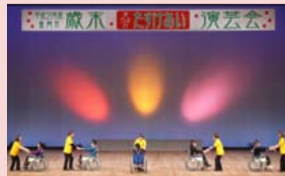
写真は昨年の歳末たすけあい演芸会の様子

入場料：無料(入場整理券は盛岡市社会福祉協議会、盛岡市社会福祉協議会玉山支所で配布しています。その際には、歳末たすけあい運動の趣旨にご賛同いただき、1口500円を目安とした募金協力をお願いします。)