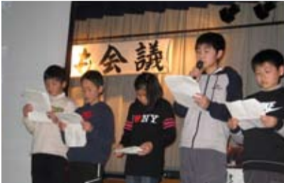
写真は昨年の事例発表の様子

各地区子ども会の活動事例発表や、子ども会活動の計画・実践についての情報交換などが子どもたちの運営で行われます。