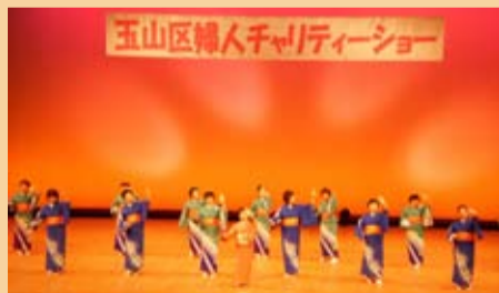
写真は昨年のチャリティーショーの様子

日時：12月5日(日) 午前10時開演 場所：盛岡市波民文化会館 姫神ホール 主催：玉山区女性団体協議会 内容：踊り、歌、ダンスなど 入場料：1人 500円(当日券600円) 収益金は歳末たすけあい義援金として寄付されます。 問い合わせ：波民公民館 TEL 683-2354