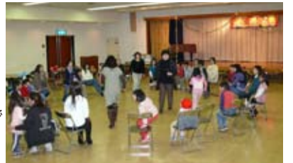
写真は昨年のクリスマス会の様子

盛岡市母子寡婦福祉協会・盛岡市・盛岡市社会福祉協議会では、母子父子世帯を対象とした「親と子のクリスマス会」を開催します。ゲーム等盛りだくさん内容を企画中ですのお楽しみに。