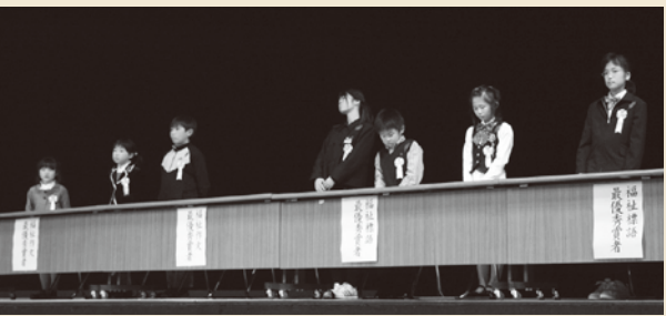
作品を朗読発表した最優秀賞受賞者のみなさん

この活動で少しでも多くの人が喜んでくれるなら、わたしもうれしい。これからもこの活動を続けていきたい。看護師さんから教わった、お互いが笑顔になれるあいつも今のわたしにできる事だから実践していきたい。