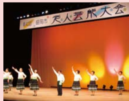
昨年度の大会の様子