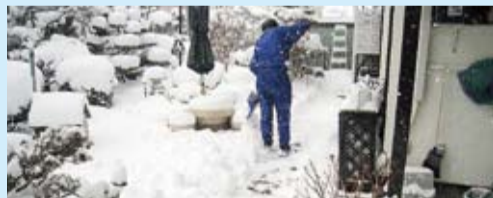
写真は昨シーズンの雪かきボランティア活動の様子

また、除雪を行う日時などはボランティアの活動可能時間等により調整させていただきますので、あらかじめご承知おください。