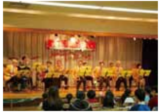
写真は昨年のクリスマス会の様子

日時：12月7日(日) 午後1時～午後3時30分 場所：盛岡市総合福祉センター 対象：中学生までの子どものいる母子父子世帯 参加費：無料 申し込み：11月28日までに盛岡市社会福祉協議会 TEL 651-1000