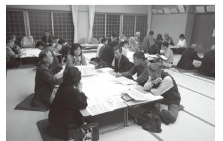
北厨川地区福祉懇談会の様子