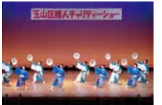
昨年のチャリティーショーの様子

日時：12月7日(日) 午前10時開演 場所：盛岡市 渋民文化会館 姫神ホール 主催：玉山区女性団体協議会 内容：踊り、歌、ダンスなど 入場料：1人 500円(当日券600円)収益金は歳末たすけあい義援金として寄付されます。 問い合わせ：渋民公民館 TEL 683-2354