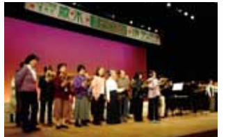
昨年の歳末たすけあい演芸会の様子

日時：12月12日(金) 午前11時開演 場所：岩手県民会館大ホール 内容：踊り、ダンス、コーラスなど 主催：盛岡市退職女性教職員の会、盛岡市地域女性団体協議会、盛岡市母子寡婦福祉協会、盛岡地区更生保護女性の会