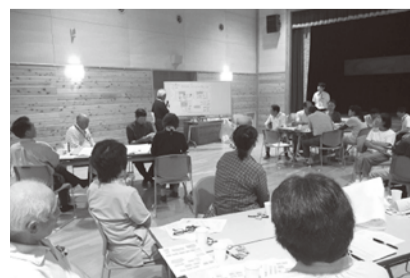
玉山・薮川地区福祉懇談会の様子