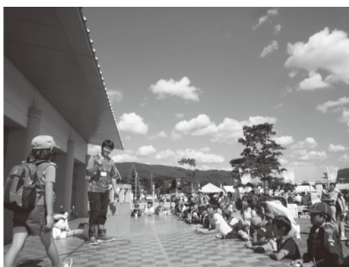
お楽しみ抽選会の様子

盛岡市ボランティアまつりふれあい広場を9月21日(日)にふれあいランド岩手を会場に開催しました。このボランティアまつりは、盛岡市民の方々にボランティアや福祉に興味を持ってもらうことやボランティア団体の普段の活動の発表の場として開催しています。