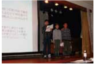
写真は昨年の子ども会議の様子

日時：1月18日(日) 午後1時～午後3時40分 場所：盛岡市総合福祉センター 対象：各単位子ども会代表及び世話人、子ども会関係者 問い合わせ：盛岡市社会福祉協議会 TEL 651-1000