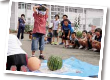
平成26年度事業から災害時相互支援協定調印、地区福祉懇談会、児童館活動