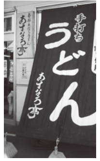
産直入り口の看板