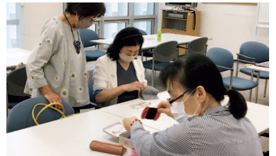
マスクづくり講習会の様子

また、高齢者サロン活動の再開支援のため、盛岡社協の生活支援コーディネーターが中心となってボランティアを募り「マスクづくり講習会」を開催し、サロン世話人へ完成したマスクを配布する活動をおこないました。(2面に関連記事掲載)