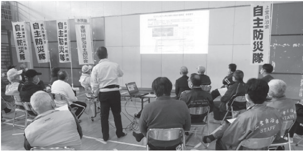
防災訓練の様子(東厨川)

地区福祉推進会は、地域の特性に応じた福祉活動の活発化を図ることを目的に市内32地区に設立された組織です。事務局は主に老人福祉センターなどに置かれ、社会福祉事業の充実や発展のためさまざまな活動をおこなっています。今年度は、コロナ禍により例年通りの活動が困難な状況ではありましたが、感染予防を図りながら、開催された活動を紹介します。