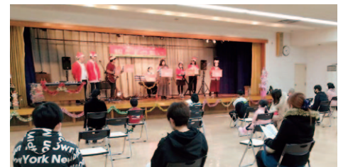
親と子のクリスマス会

盛岡市母子寡婦福祉協会との共催による「親と子のクリスマス会」は、時間短縮とソーシャルディスタンスを確保しながらの開催でしたが、ボランティアの演奏とクリスマスプレゼントの贈呈に、参加した親子は楽しい時間を過ごしました。