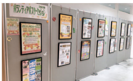
ボランティアポスターセッション

盛岡市ボランティア連絡協議会はボランティアまつり「ふれあい広場」に代え、クロステラス盛岡でボランティアポスターセッションを開催し、市民にボランティア活動の様子をPRしました。