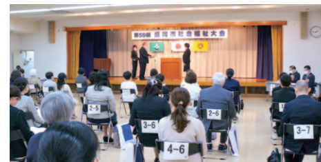
縮小開催した盛岡市社会福祉大会