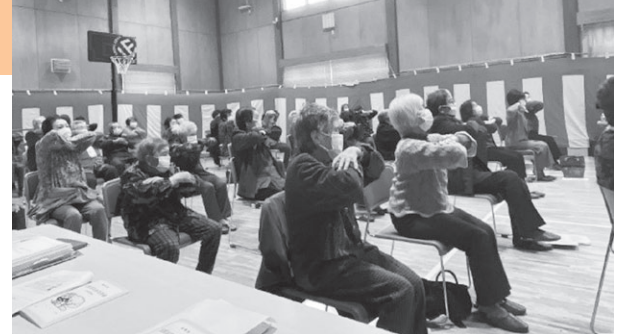
ふれあい給食会の様子(築川)

当日は、五月園地域包括支援センターの職員による介護予防講話や自宅でも簡単にできる体操などの紹介がありました。