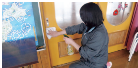
児童館を消毒する様子