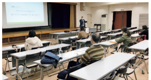
ボランティア入門講座

ボランティア入門講座では、限られた人数の中でも幅広い世代の参加があり、「コロナ禍のボランティア活動」をテーマに学びました。