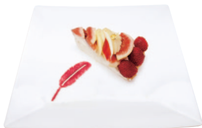
寄付つき商品：赤い羽根のケーキ

盛岡市共同募金委員会は、企業の協力による寄付つき商品の開発に取り組んだほか、募金ボランティアの協力で撮影した広報動画をYouTubeや市内各地で配信するなど、情報発信をおこないました。