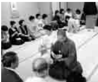
結構なお手前でした