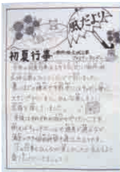
参加児童に届けている会報「風だより」