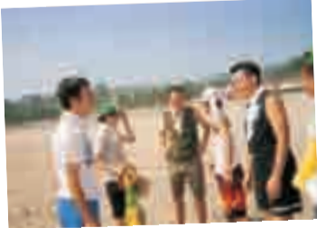
コアメンバーの打ち合わせ