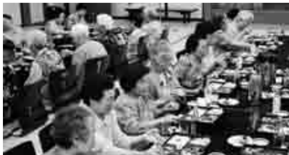
豪華な昼食におもわずにっこり

盛岡市社会福祉協議会玉山支所が行っているいきいき高齢者通所支援事業のバスハイクが6月13日に行われ、65名の利用者が参加しました。