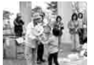
たくさんの景品を贈られる参加者

参加者にはゴール後、得点に応じて景品が贈られたほか、宝探しや柔らかいフライングディスクを使った遊びなどでゴールデンウィーク最後の休日を楽しみました。