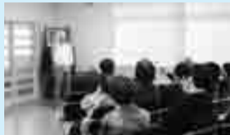
座談会（悪徳商法について）

作成などの青少年育成活動、毎年洪民小学校を会場に盛大に行われる地区民運動会、ソフトボール大会、室内球技大会などの健康増進活動、全自治会で行う地域清掃活動などを行っています。 新年度からは地域の高齢者支援活動にも力を入れることになっており、シルバーメイト事業と併せて災害時支援体制の整備を進めることとして