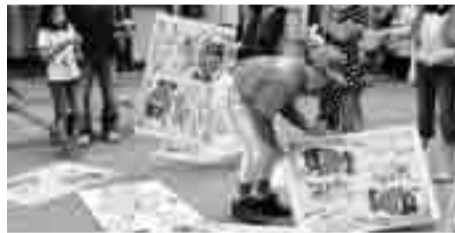
大きなカードで神経衰弱

当日はあいにくの雨のため、ホットライン肴町での開催となりましたが、昔懐かしい遊びやさまざまなゲームに約200名の子どもたちの声が会場いっぱいに響いていました。