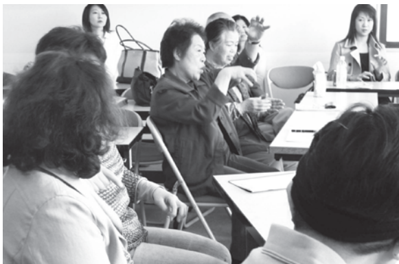
毎週月曜日に開かれる勉強会。和気あいあいと会話が交わされる

手話サークル月曜会の勉強会は、ろうあ者と健常者が一緒に参加して、ろうあの人から健常の人が手話を学ぶ、という形式をとっている。