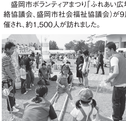
わくわく子どもランド

盛岡市ボランティアまつり「ふれあい広場」（主催：盛岡市ボランティア連絡協議会、盛岡市社会福祉協議会）が9月26日、ふれあいランド岩手で開催され、約1,500人が訪れました。