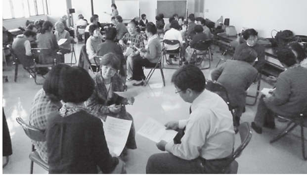
ロールプレイングでさまざまなケースの傾聴を学ぶ

独り暮らし高齢者や認知症の人などを対象にした傾聴ボランティアはまだ普及が進んでおらず、高齢社会の中でその活動の輪がひろがるのが求められている。