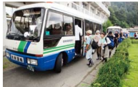
かわいキャンプでのボランティア送迎の様