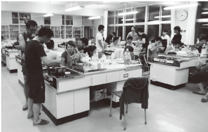
夕食の様子。食堂にはガスコンロやシンクが組み込まれた調理台が8台

翌日のニーズを確認し、どこで活動するか考えているボランティアさん。 各災害ボランティアセンターからのニーズは、ガレキ撤去や泥上げ、写真洗浄といった重労働から、サロン活動をはじめ、仮設住宅に住んでいる人同士のつながりが形成される支援といったものまで多岐にわたっています。