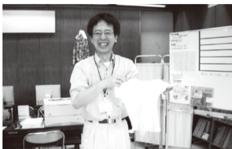
被災地に「手作りベビー肌着」を届ける。宮古市役所で

盛岡女性の船の会は、かつて岩手県が行っていた「婦人の船洋上セミナー」(のち「女性の船洋上セミナー」)に盛岡市から参加した人たちによって昭和58年に結成された。