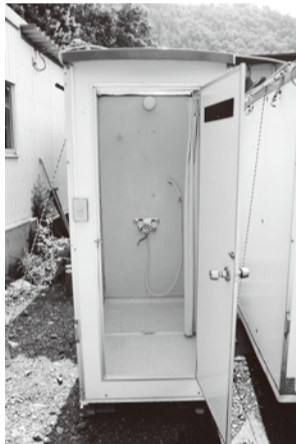
簡易シャワー8台を設置。もちろん、お湯が出ます。