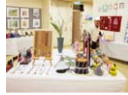
昨年の作品展の様子