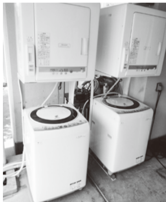
乾燥機付きの洗濯機4台を設置

かわいキャンプの利用申込は、利用予定日に空きがあるか電話で確認後、利用申込書をFAXまたはメールで送信という手順をお願いします。FAXやメールを送信できない場合はその旨スタッフにお申し付けください。