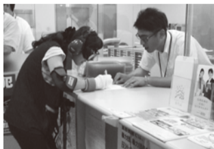
高齢者疑似体験の装具を着けて帳票に記入する