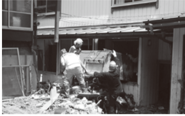
大きな家財を屋外へ運び出す場面も