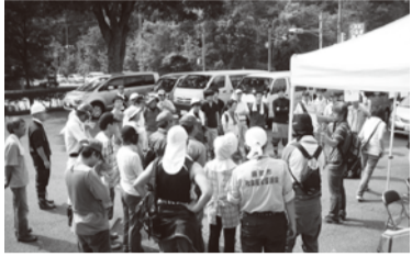
活動初日、8月11日の朝に集合したボランティア