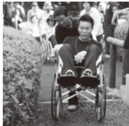
ふれあいランド岩手で開かれた講習会。 砂利道を車いすで移動する

会の名称のUS (Universal Service) =ユニバーサル・サービスは、「どなたにも分けへだてのないサービスを提供したい」という思いを込めたネーミング。高齢者や身体に障がいを持った人でも安全に安心して買い物や観光ができるように支えてあげよう。そして、そういうことができる