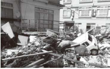
瓦礫の中に埋もれた自動車

8月9日の大雨による土砂災害など、被災した地域の復旧を支援するため、盛岡市からの要請により8月10日に盛岡市災害救援ボランティアセンターを設置しました。