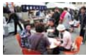
平成22年のボランティアまつり ふれあい広場の様子

今回は、沿岸部で津波の被害にあい、ボランティアの手で洗浄、復元された写真の返却会を開催します。ぜひお誘いあわせの上、ご来場下さい。