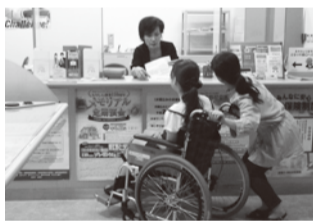
車いすで窓口カウンターに行く

盛岡市社会福祉協議会では、学校だけではなく企業等にも職員の派遣を行っています。申込みを希望される方は、希望日の2週間前までに社会福祉協議会地域福祉課までにご連絡をお願いいたします。