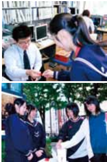
昨年の街頭募金の様子

今年も10月1日から共同募金が始まります。共同募金運動は、都道府県ごとに行われており、災害の時などの例外を除き、集まった募金はその県内で使いみちが決められます。つまり、寄付した皆さんの地域で役立てられている募金です。