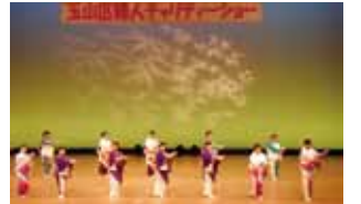
昨年の催しの様子

玉山区女性団体協議会が主催で歳末たすけあい運動に協力することを目的に開催します。 日時:12月6日(日) 午前10時開演 場所:盛岡市渋民文化会館 姫神ホール 内容:踊り、歌、ダンスなど 問い合わせ:渋民公民館 TEL 683-2354