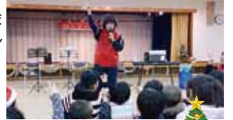
昨年の催しの様子

母子父子世帯を対象としたクリスマス会を開催します。ゲームや楽器の演奏など、たくさんの企画を予定しておりますので、是非ご参加ください。 日時:12月12日(土) 午後1時～午後3時30分 場所:盛岡市総合福祉センター 対象:中学生までの子どもがいる母子父子世帯 参加費:無料 申し込み:11月30日までに盛岡市社会福祉協議会までお申込みください。 TEL 651-1000