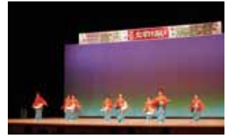
昨年の催しの様子

市内の女性団体が歳末たすけあい運動の趣旨に賛同し同運動に協力することを目的に開催します。 日時:12月2日(水) 午前11時開演 場所:岩手県民会館大ホール 内容:踊り、ダンス、コーラスなど 主催:盛岡地区更生保護女性の会、盛岡市退職女性教職員の会、盛岡市母子寡婦福祉協会 共催:盛岡市町内会連合会、盛岡市民生児童委員連絡協議会、盛岡市社会福祉協議会 入場料:無料(入場整理券は盛岡市社会福祉協議会、盛岡市社会福祉協議会玉山支所で配布しています。歳末たすけあい運動の趣旨にご賛同いただき、1口500円を目安とした募金協力をお願いします。※当日会場でも配布します。) 問い合わせ:盛岡市社会福祉協議会 地域福祉課 TEL 651-1000