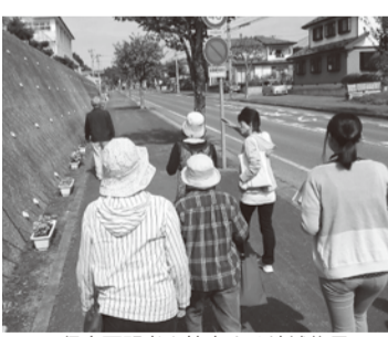
行方不明者を捜索する地域住民