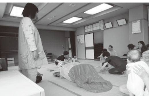
写真は子育てサロンの様子

開催時間：年5回 午前10時～11時半 場所：大慈寺児童センター 対象者：0歳から就学前の子供と保護者 内容：親子でリズム体操、絵本の読み聞かせなど 会費：無料 ※お車でお越しの際は、駐車場スペースが限られておりますのでお近くの駐車場をご利用ください。