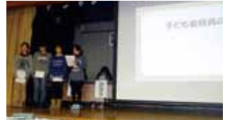
昨年の催しの様子

盛岡市内の子ども会に所属する子どもたちの運営により、各地区の子ども会の活動事例の発表や子ども会活動の計画・実践についての情報交換会が行われます。 日時:1月17日(日) 午後1時～午後3時40分 場所:盛岡市総合福祉センター 対象:各単位子ども会代表及び世話人、子ども会関係者 問い合わせ:盛岡市社会福祉協議会 地域福祉課 TEL 651-1000