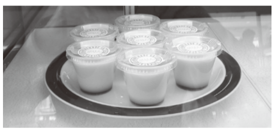
人気のカスタードプリン

「カナン市場」の商品は、カナンの園グループ事業所をはじめ次のところで販売しています。 ななっく・キューブII・アネックスカウトク・結いの市