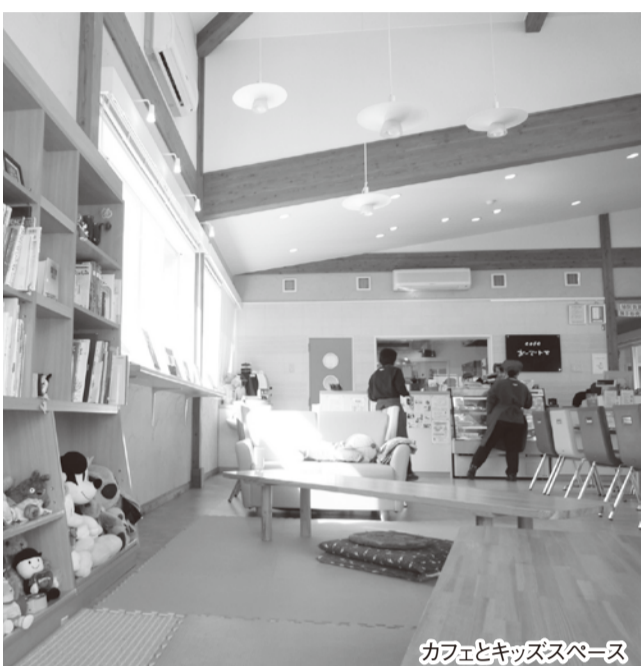
カフェとキッズスペース

「となんカナン」はカナンの園各事業所がつくる商品のアンテナショップにもなっていて、ショップコーナー「カナン市場」にはさまざまな商品が並んでいます。ショップコーナーと一緒にカフェがあり、その中に幼児が遊べるキッズスペースがあります。小さな子どもを連れてお父さんお母さんが、食事、喫茶をしながら子どもを遊ばせておける子育て支援スペース。ここではクリスマスやひな祭りに家族で写真を撮るイベントがあります。2階貸しスペースではベビーダンスが行われたり、秋にはこれも子育て支援のフリマ、春先にはグループ事業所の園芸部が育てた花の鉢植えを売る園芸フェアが施設前広場で開かれるなど、地域の人たちに開かれており、来場者と施設利用者とのほほえましいふれあいの場面も見られる施設です。