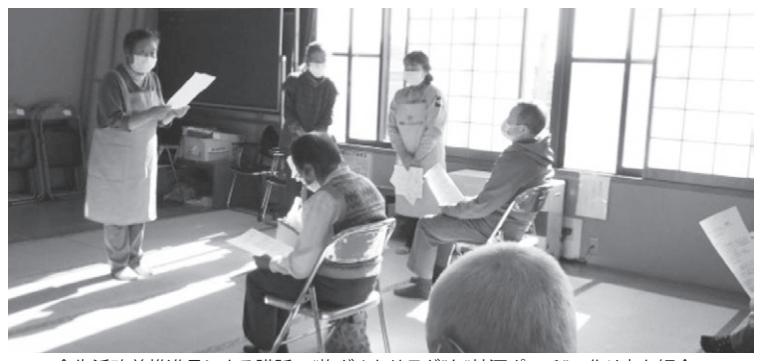
食生活改善推進員による講話 “梅グルトサラダ”と“甘酒ボンチ”の作り方を紹介