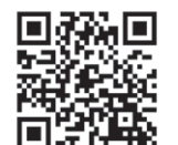
QRコードからもご覧いただけます。