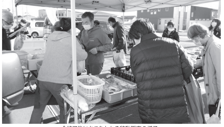
会終了後におこなわれる移動販売の様子