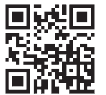
QRコードからもご覧いただけます。

回収場所や詳しい内容については、フードバンク岩手のホームページをご覧ください。 https://foodbankiwate.org/