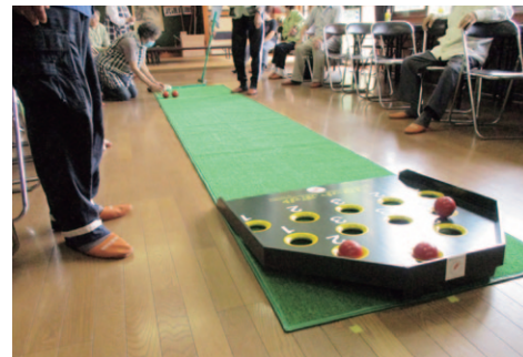
助成を利用したサロン活動の様子(ニュースポーツ)

赤い羽根共同募金は、高齢者や子ども等の地域住民が集まる居場所であるサロン活動の運営や、保育園・高齢者施設の改修、障がい者施設の送迎車両の整備など様々な地域福祉活動に使用されているほか、市民福祉団体の活動にも活用され、高齢者の生きがいづくりや児童福祉の充実が図られています。