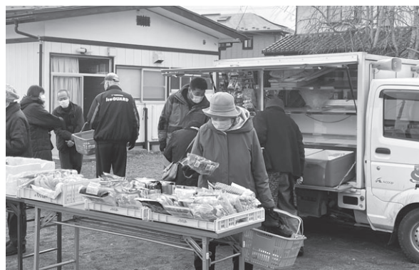
サロンでの移動販売の様子

盛岡市社協では、コロナ禍におけるサロン活動再開支援の一環として、サロン世話人さんと移動販売業者(「サロndeお買い物」のネットワーク登録業者)をマッチングし、身近なサロンで買い物ができるようサポートしています。